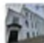
Фото объекта 1